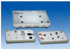
感測器與一般傳感器特性實驗

6. KL-68006 角度/距離滑動平台 7. KL-68007 光學尺移動平台 8. KL-68008 標準砝碼 9. KL-68009 旋轉編碼器