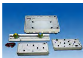
紅外線傳感器實驗