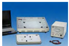
光伏打電池傳感器實驗