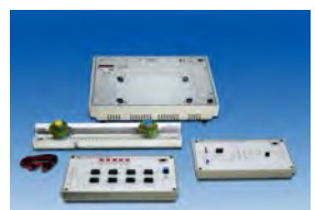
超音波傳感器實驗