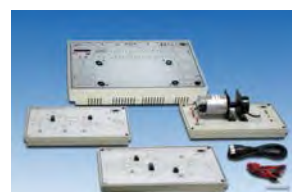
V/F, F/V 轉換器實驗